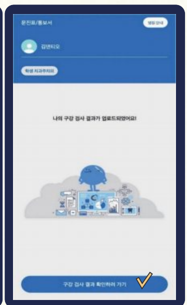
치과에서 검진결과 입력 후 구강검진결과와 통보서 확인