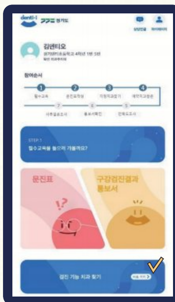
치과 예약 후 방문